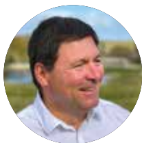
Frédéric Dupic Maire de Montussan.